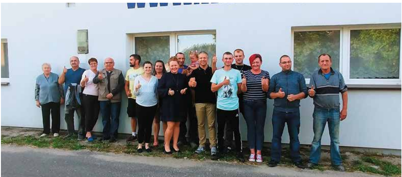
Zdjęcia z wyborów w Jarchlinie