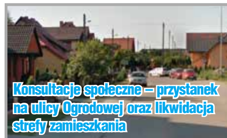
Konsultacje społeczne – przystanek na ulicy Ogrodowej oraz likwidacja strefy zamieszkania