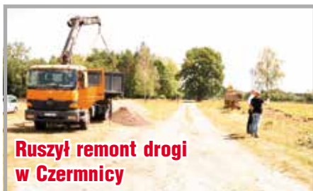
Ruszył remont drogi w Czermnicy