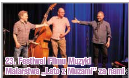
23. Festiwal Filmu Muzyki Malarstwa „Lato z Muzami” za nami: