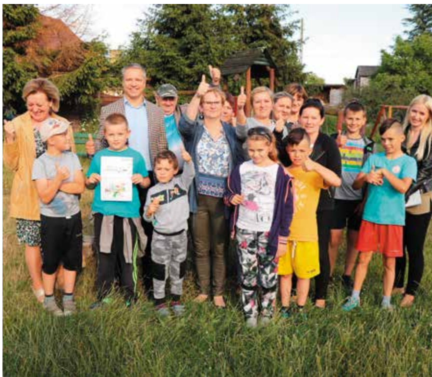
Dalsza część spotkania burmistrza z mieszkańcami dotyczyła już spraw wewnętrznych. (ps)

Ostatecznie została wybrana ta wersja, która najbardziej przypadła do gustu młodym mieszkańcom Błotna, którzy obecni na boisku szkolnym, jednogłośnie opowiedzieli się za przedstawionymi przez burmistrza propozycjami.