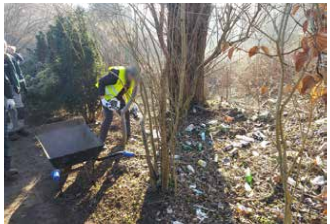
Sprzątanie zieleńców za garażami - ul. 5Marca