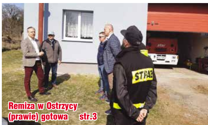
Remiza w Ostrzycy (prawie) gotowa str.3