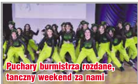
Puchary burmistrza rozdane, tancy weekend za nami