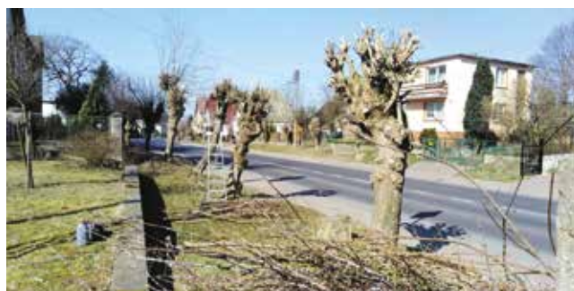
Cięcie gałęzi drzew - ul. Kościuszki