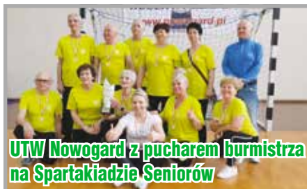
UTW Nowogard z pucharem burmistrza na Spartakiadzie Seniorów