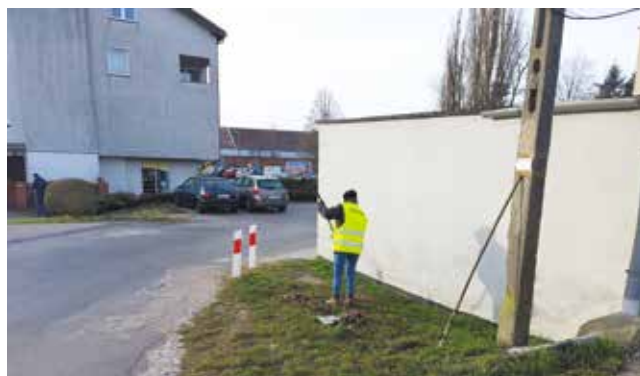
Sprzątanie przy ul. 5 Marca