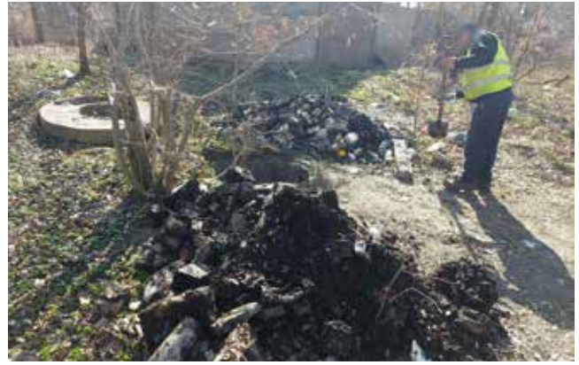
Czyszczenie studni deszczówki - osiedle Radość