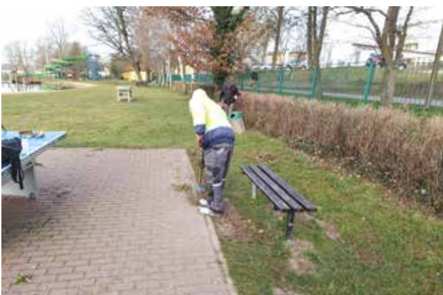
Prace na plaży miejskiej