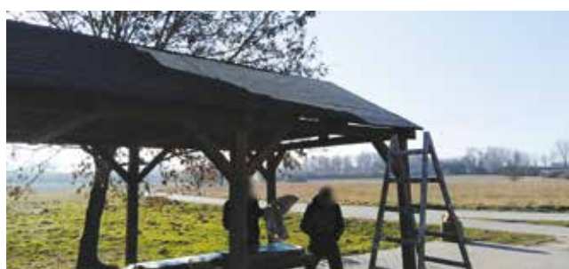
Naprawa daszku przy przystanku piknikowym - trasa ścieżki jeziora