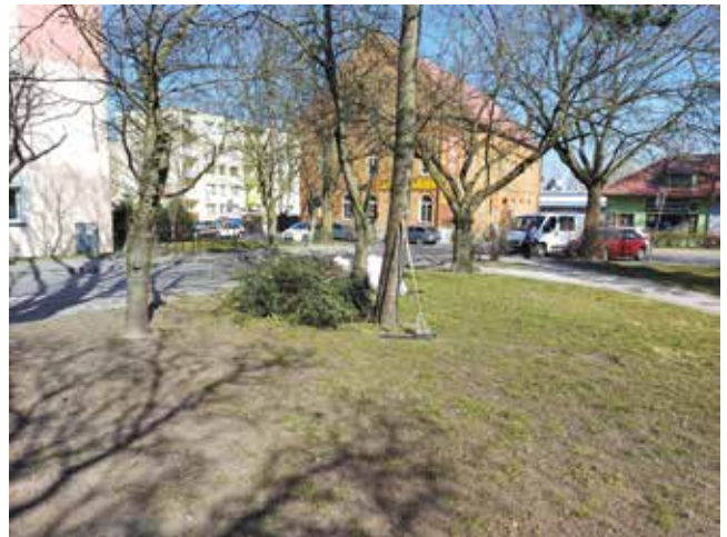
Prace porządkowe przy toalecie miejskiej