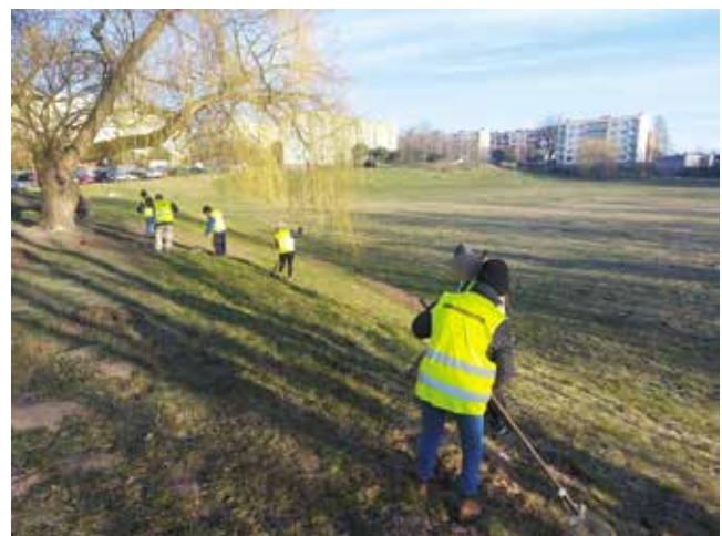
Grabienie skarpy przy ul. Kowalskiej