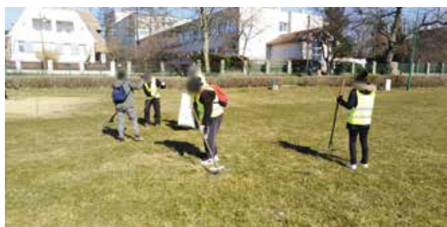
Sprzątanie plaży miejskiej