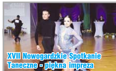
XVII Nowogardzkie Spotkanie Taneczne - piękna impreza