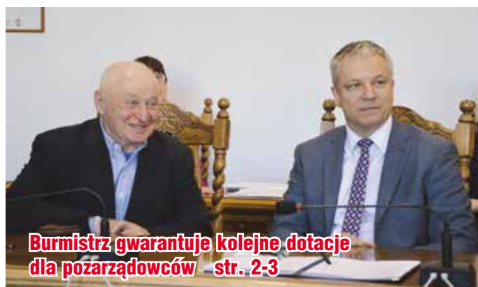
Burmistrz gwarantuje kolejne dotacje dla pozarządowców str. 2-3