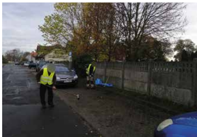
Zamiatanie chodników i poboczy - ul. Cmentarna i ul. Nadtorowa