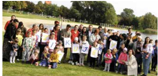
24 вересня Родинний пікнік на пляжі 24 Września Piknik rodzinny na plaży

Дітки біженців могли ходити безкоштовно на гуртки з від НДК. Дорослих навчали і продовжують навчати польської мови в Бібліотеці. Товариство Діабетиків допомагає людям з цукровим діабетом. Пхлі targ дозволяв українцям продавати свої товари на ярмарку. Університет 3 Віку запросив людей пенсійного віку до себе на пікнік, щоб краще познайомитися. Понад 3 місяці тривав інтеграційний проект від Позаурядових Організацій, де поляки разом з українцями могли провести вдосталь часу разом, вивчаючи польську мову, танцюючи зумбу, відвідуючи майстер-класи від Еко-дзела, спілкуючись з психологом і через розвиток акторської майстерності на театральній анімації. Одразу прошу вибачення, якщо когось не назвала тут, я знаю, що Вас було дуже багато.