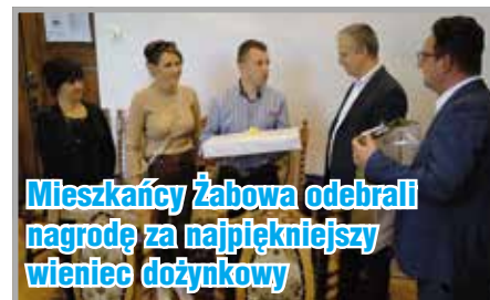
Mieszkańcy Żabowa odebrali nagrodę za najpiękniejszy wieniec dożynkowy