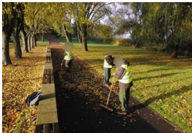
Zamiatanie liści ze ścieżki pieszko-rowerowej wokół jeziora