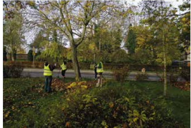
Zamiatanie chodników i grabienie liści na placu Ofiar Katynia