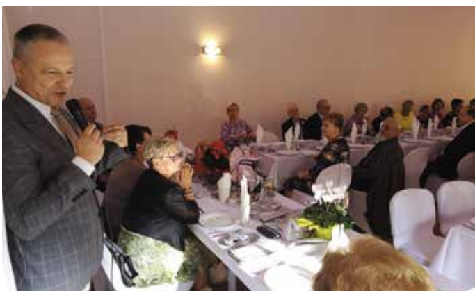
Nowogardzki Uniwersytet Trzeciego Wieku rozpoczął kolejny rok akademicki str.5