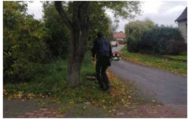
Koszenie trawy pobocza - ul. Sikorskiego