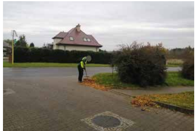
Zamiatanie liści na ulicy Poniatowskiego