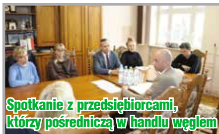
Spotkanie z przedsiębiorcami, którzy pośredniczą w handlu węglem