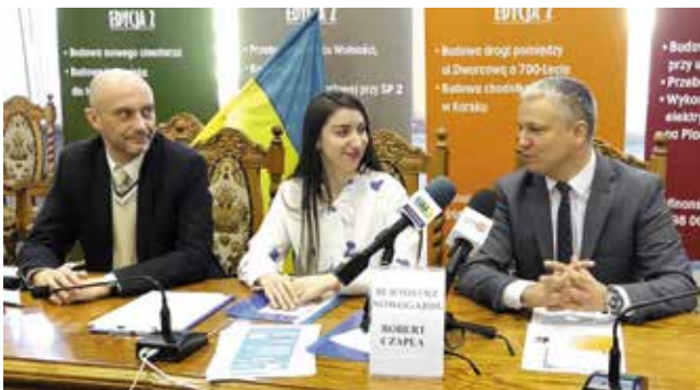
15 Березня Мер міста призначив уповноважену особу до справ польсько-українських

За ці 8 місяців було зроблено дуже багато. 1080 номерів Песель було видано працівниками Ужєнду. 589 людей отримали одоноразову допомогу від ОПС. 293 мешканці з Гміни Новогард прихистили біженців з України. 222 родинам