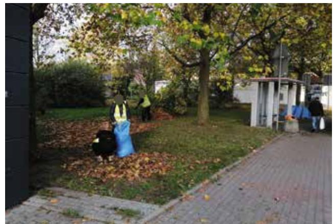
Grabienie liści placów zielonych przy ul. Bankowej, ul. Warszawskiej