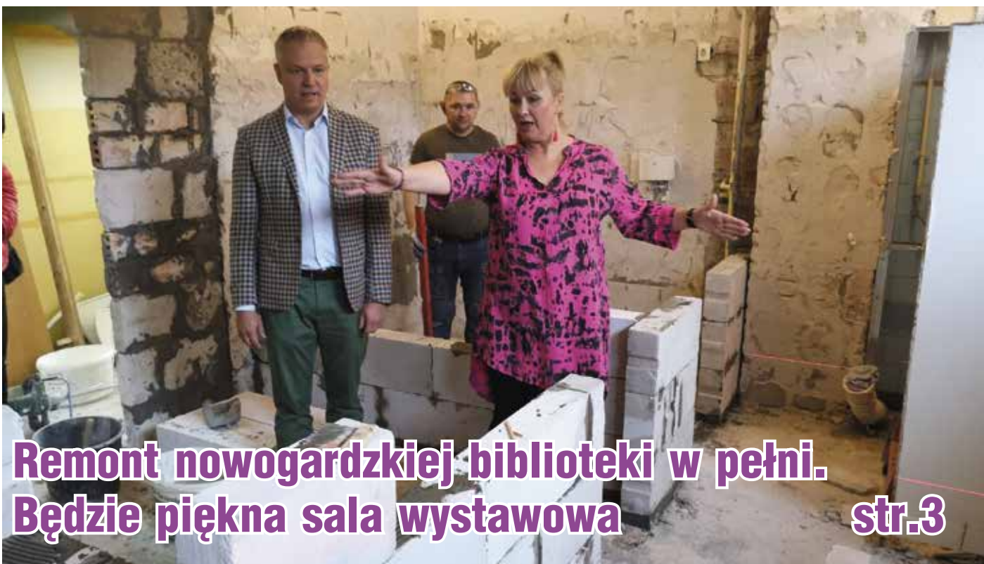
Remont nowogardzkiej biblioteki w pełni. Będzie piękna sala wystawowa str.3