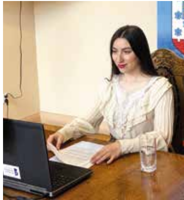
27 травня 10.30 Прямий ефір 27 Мaja 10.30 Transmisja na żywo

Burmistrz, mieszkańcy Nowogardu, organizacje wolontariackie, organizacje pozarządowe, Caritas – wszyscy starali się pomóc Ukraińcom.