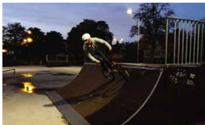
Skatepark wreszcie oświetlony. Można szaleć do woli str.2