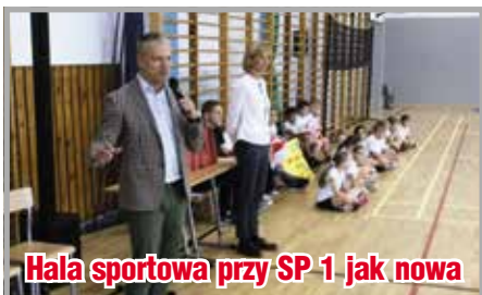
Hala sportowa przy SP-1 jak nowa