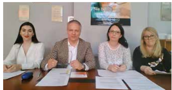
26 Квітня Конференція з працівниками OPS 26 Kwiecienia konferencja z pracownikami OPS

W ciągu tych 8 miesięcy zrobiono bardzo dużo. 1080 Numerów Pesel zostało wydanych przez pracowników Urzędu. 589 osób otrzymało jednorazową pomoc od OPS. 293 mieszkańców Gminy Nowogard udzieliło schronienia uchodźcom z Ukrainy.