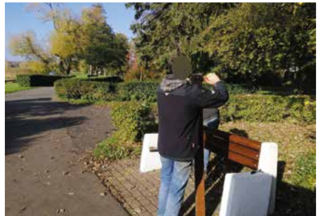
Naprawa siedzisk ławeczek