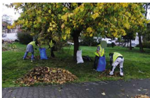
Zamiatanie zieleńców i porządku na miejscach parkingowych - ul. 5 Marca