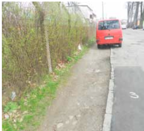
-Tak wyglądało przed...