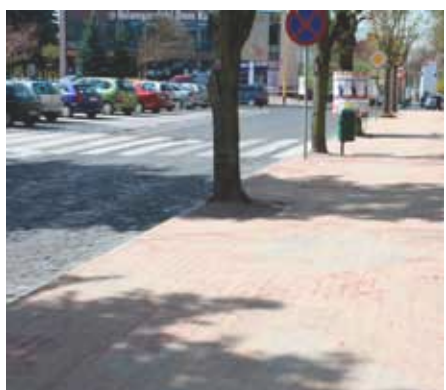
...i po remoncie