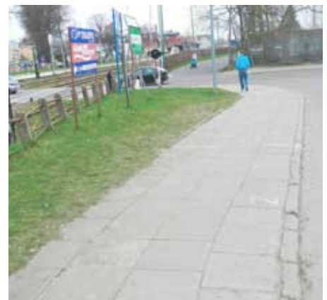
Chodnik przy ulicy Cmentarnej przed...