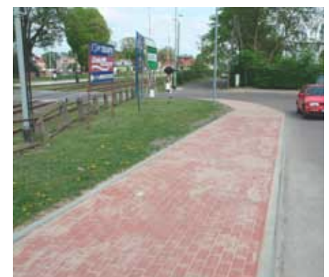
...i po remoncie