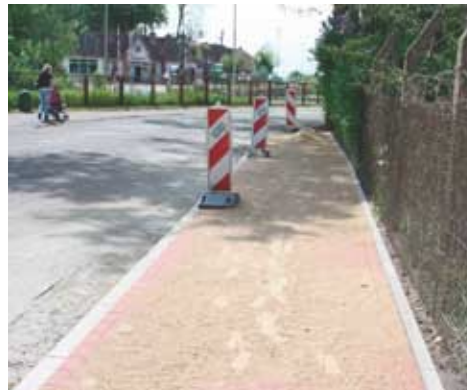
...a tak po remoncie