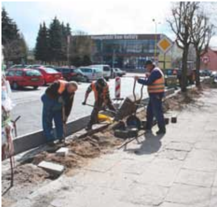
Chodnik przy Placu Wolności w trakcie...

oraz przy ulicy Nadtorowej po prawej stronie od zejścia z przejazdu na wysokość wejścia na cmentarz. Wykonawcą robót jest firma AZBUD z Nowogardu, która wygrała przetarg na tego typu prace.