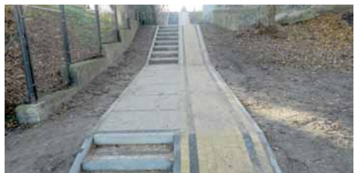
ul. Waryńskiego po remoncie