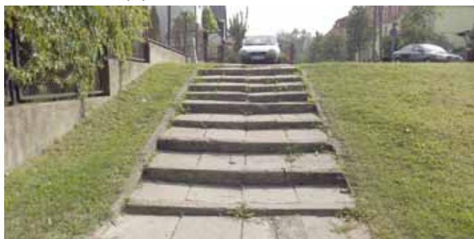
ul. Waryńskiego przed remontem

Roboty wykonała firma PPHU KUGA z Nowogardu. Wykonawca udzielił na prace budowlane 36 miesięcy gwarancji.