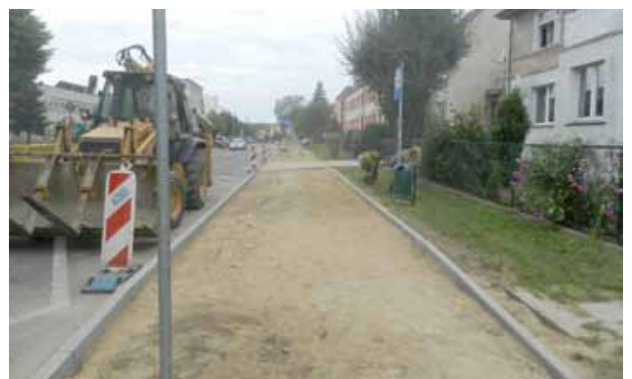
W trakcie remontu