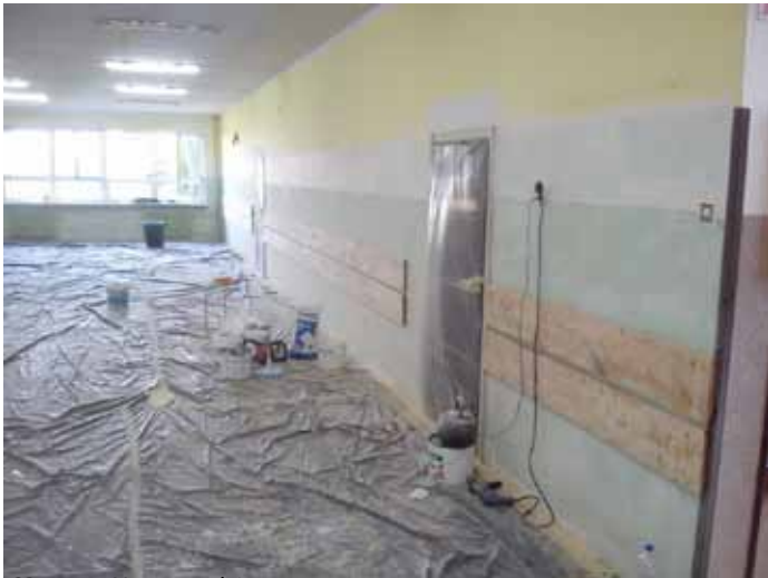
SP nr 3 w Nowogardzie

trwają prace porządkowe, wykonywane bezpłatnie przez osoby osadzone w nowogardzkim ZK.