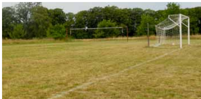
Tak wygląda dziś