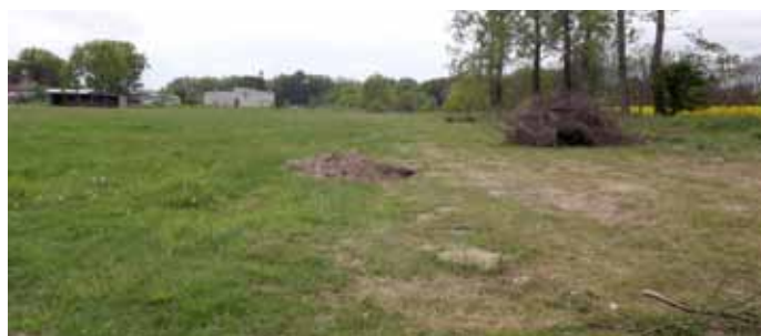
Boisko przed powstaniem