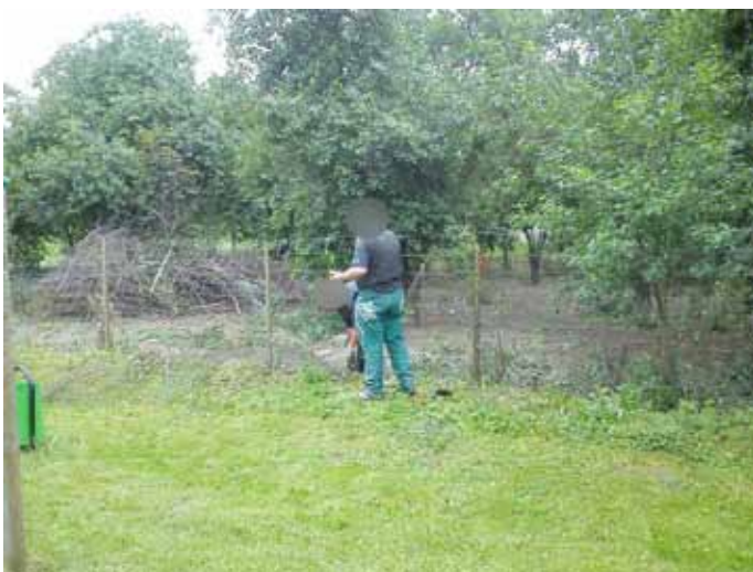
SP w Żabowie