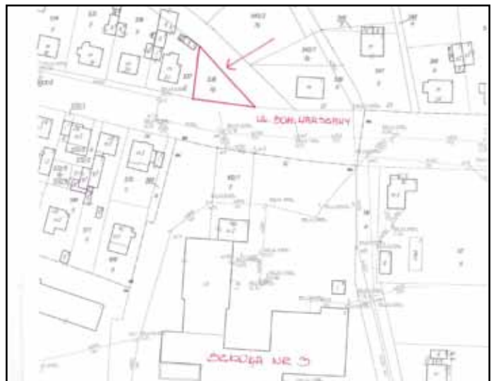
DOKUMENTACJA FOTOGRAFICZNA DZIAŁKA NR EWID. 538 OBRĘB 5 m. NOWOGARD POWIAT GOLEŃOWSKI WOJ. ZACHODNIOPOMORSKIE ul. BOHATERÓW WARSZAWY

Ogłoszenie o przetargu zamieszczono na stronie internetowej www.bip.nowogard.pl